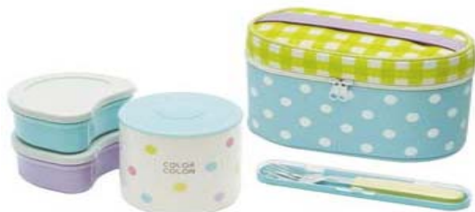
①コンビネーションカラー ブルー