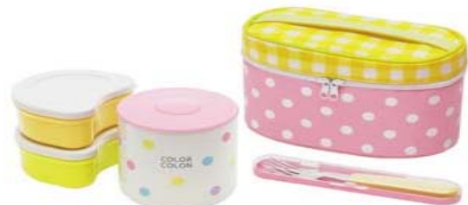
②コンビネーションカラー ピンク

お客様には大変お手数、ご面倒をお掛け致しますが、お心あたりのあるお客様は下記までご連絡下さいませよう宜しくお願い申し上げます。